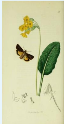
J. Curtis, Primula Veris L. (1823)